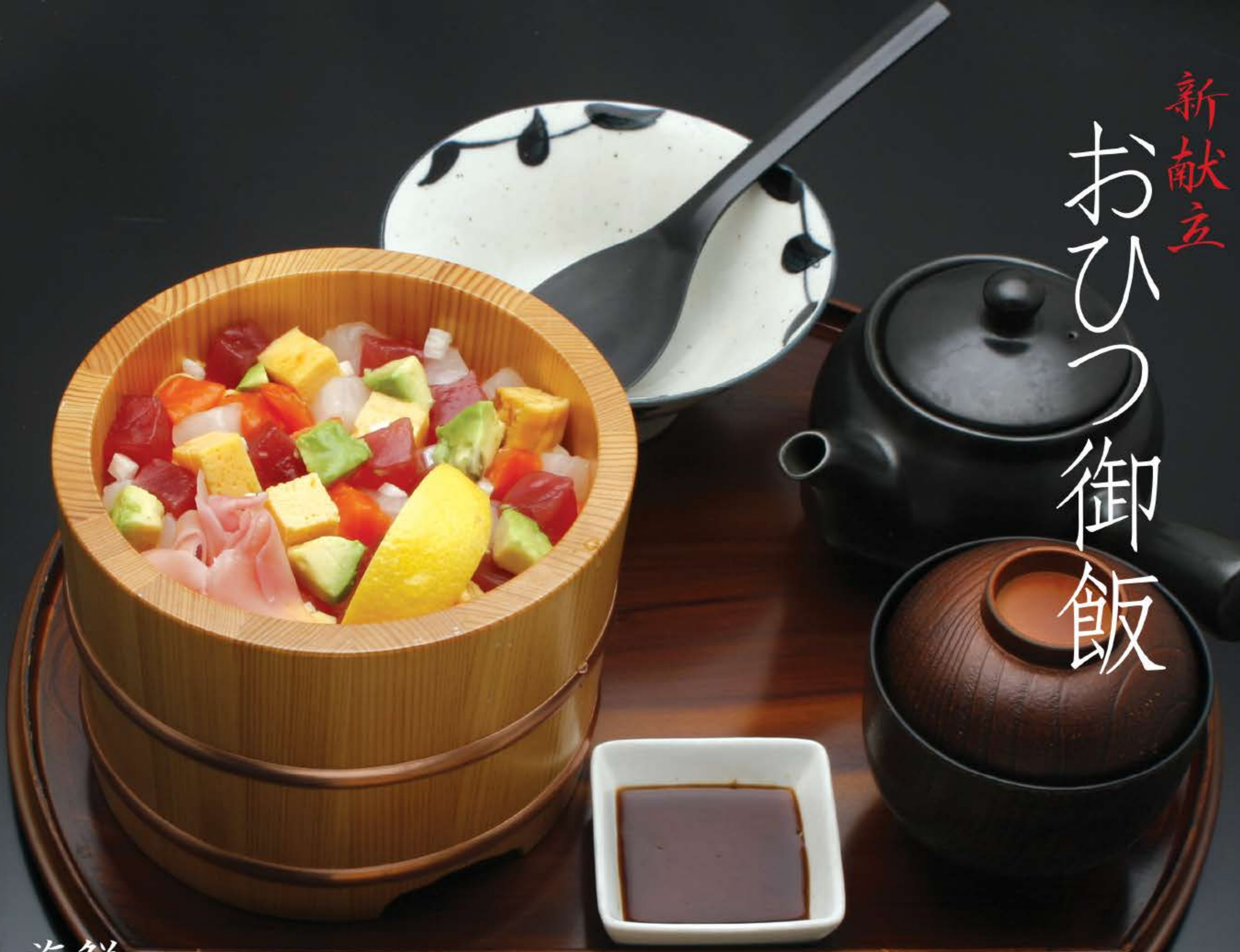
海鮮 吹き寄せ御飯 1,250円 (税込 1,350円)