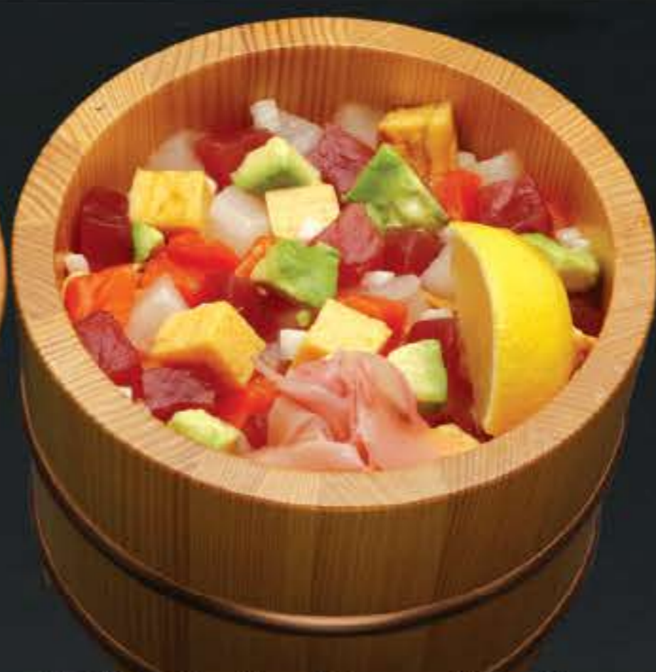
海鮮吹き寄せ御飯 1,250円 (税込 1,350円)