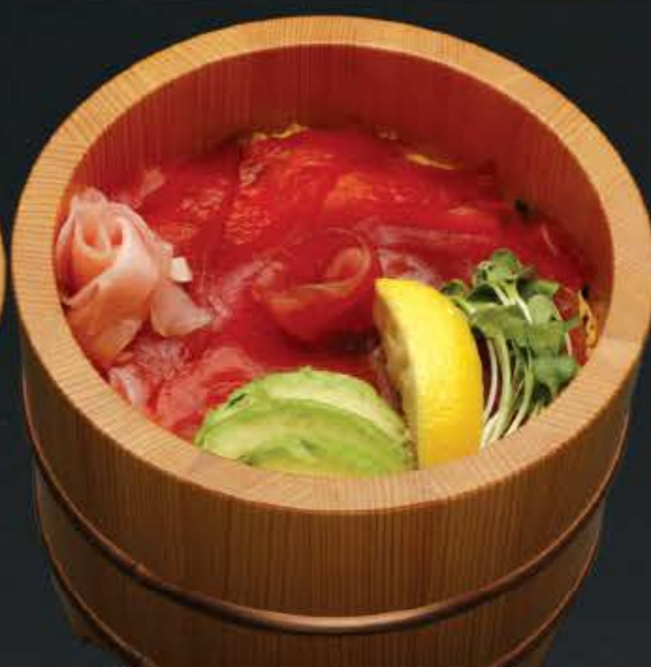
鮭アボガド御飯 980円 (税込 1,058円)