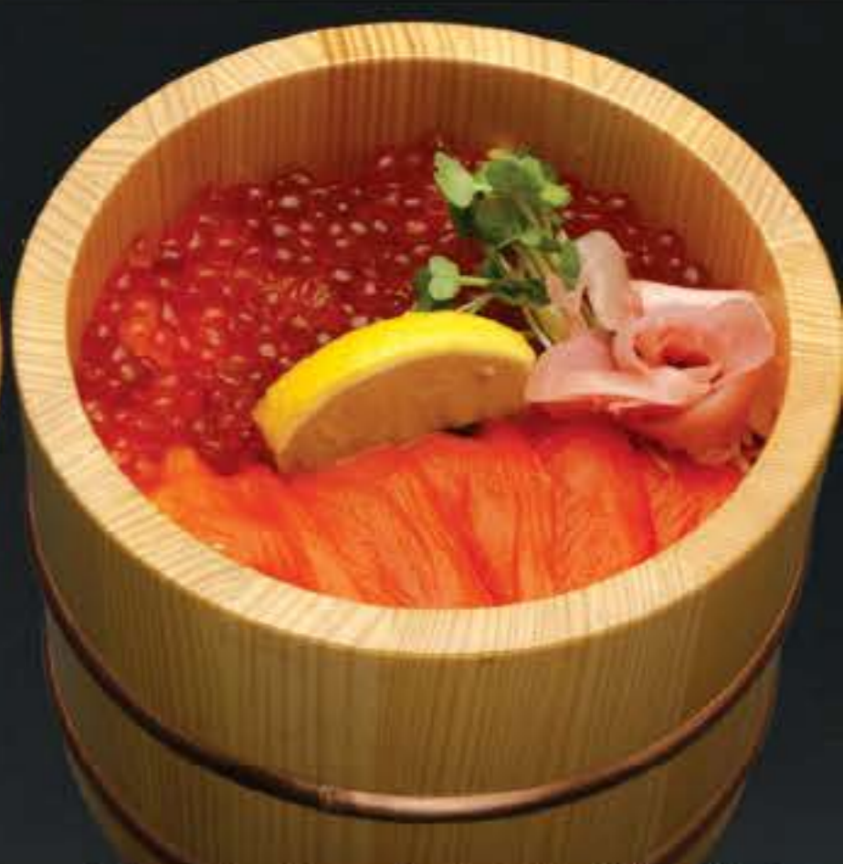
サーモン親子御飯 1,400円 (税込 1,512円)