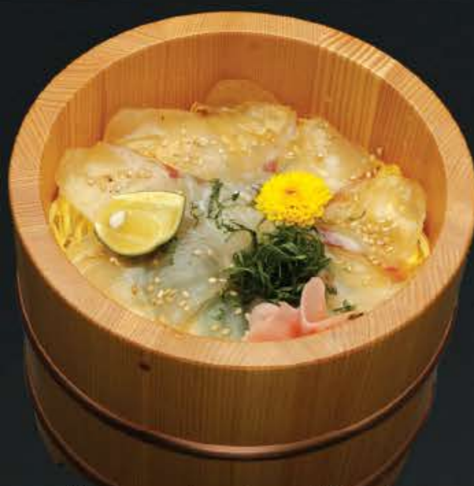
鯛昆布締め御飯 1,100円 (税込 1,188円)